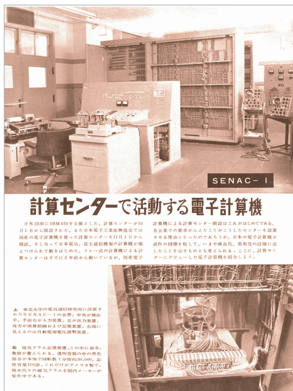
展示品 2 雑誌の記事

書かれており、SENAC-1 の性能、機器構成、利用法、利用可能分野、そしてプログラミングの例が記載されています。紹介されているプログラミング言語は機械語のようです。当時の読者は、この機械語の意味を理解できたのでしょうか。最後に全文を掲載いたしました。この資料から、計算機の構成とその利用環境など、当時の計算機センターの雰囲気を感じていただけたらと思います。他の資料、「SENAC-1 演算制御について」では、演算回路とその制御回路の概略、「SENAC-1 のプログラムについて」では、数値計算を念頭においた機械語によるプログラムと数式の自動プログラムが説明されています。「SENAC-1 の概説」では、開発目的、基本設計、諸元について書かれており、その内容は前回紹介いたしました。ちなみに、機械語という表現は筆者が記したものであり、今回紹介した資料では、見当たりませんでした。多くは Instruction Code、命令、Register、Memory、記憶装置という表現でだけ説明されています。