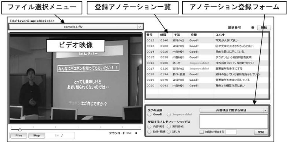
図2：プレゼンテーションビデオ登録用の情報システム

選択メニュー」から選択し、アノテーションの付記が可能となる。加えて、図1のビューアからの視聴も可能となる。そして、ファイルを選択すると、「ビデオ映像」に選択したビデオが流れ、「アノテーション登録フォーム」から、アノテーションの登録が可能となる。登録の方法は、基本的に選択式であるが、自由記述も可能である。登録が完了したアノテーションは、「登録アノテーション一覧」に表示される。