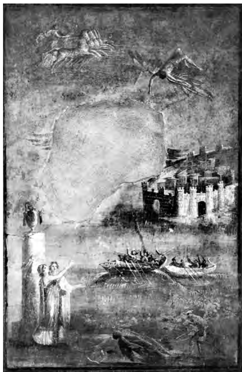
右上 図1 トリクリニウム (b) 東壁中央 《イカロスの墜落》 PPM I, p. 595より