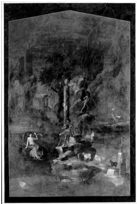
図8 「アグリッパ・ポストゥムス荘」《ポリュフェモスとガラテア》神話の間、西壁中央