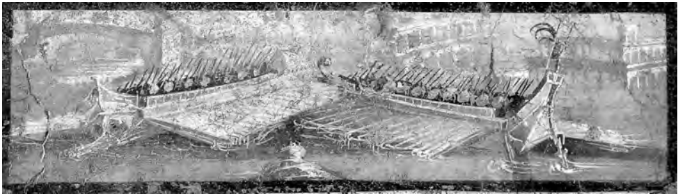
図10 イシス神殿、ポルティコ南壁、ナポリ国立考古学博物館蔵