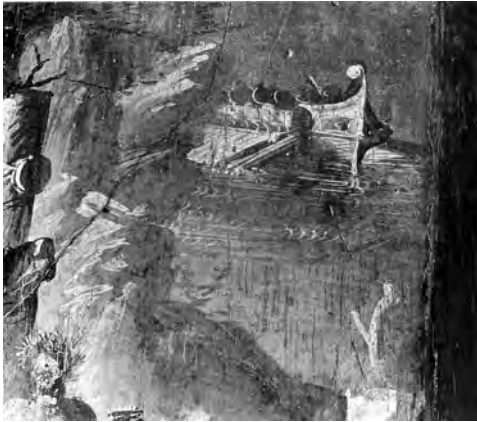
図9 トリクリニウム (b) 南壁中央 《ポリュフェモスとガラテア》部分 PPM I, p. 600より