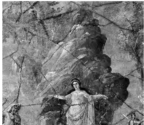
図19 トリクリニウム (b) 西壁中央 《ペルセウスとアンドロメダ》部分 PPM I, p. 603 より