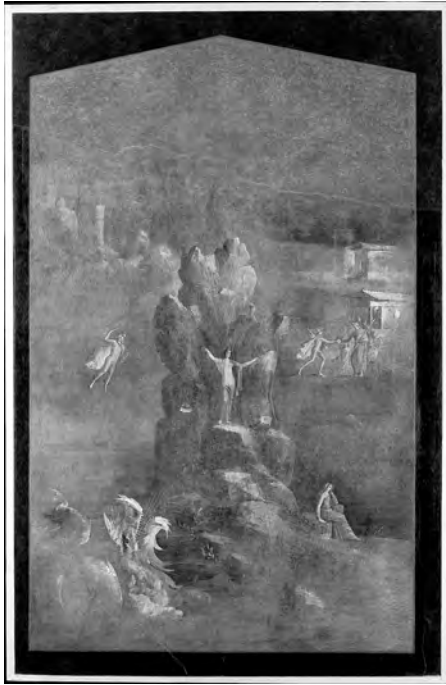
図7 「アグリッパ・ポストゥムス荘」《ヘルセウスとアンドロメダ》神話の間、東壁中央