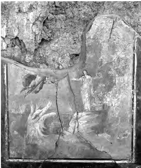
図18 ポンペイ I, 14 《ペルセウスとアンドロメダ》