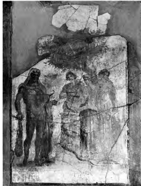
右上 図4 トリクリニウム (b) 北壁中央 《ヘスペリデスの園のヘラクレス》 PPM I, p. 592 より