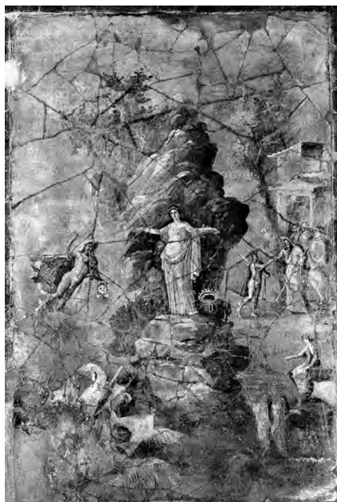
右下 図3 トリクリニウム (b) 西壁中央 《ペルセウスとアンドロメダ》 PPM I, p. 603より