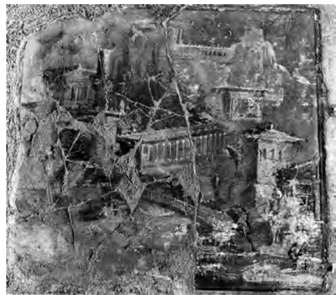
右下 図6 アーラ (d) 南壁中央 PPM I, p. 610 より