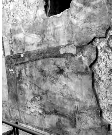
図12 郊外浴場、ニユンファエウム、北壁