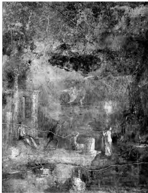
図15 「果樹園の家」 トリクリニウム (11) 東壁中央 《イカロスの墜落》 PPM II, p. 88より