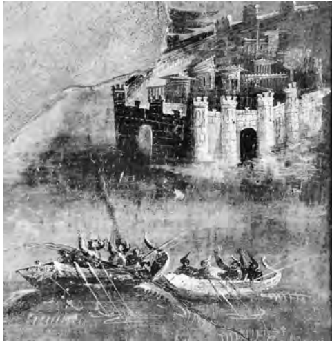
図14 トリクリニウム (b) 東壁中央 《イカロスの墜落》部分 PPM I, p. 595より