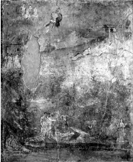
図17 「マルクス・ファビウス・セクンドゥスの家」トリクリニウム 《ローマ建国(マルスとレア・シルウィア)》、ナポリ国立考古学博物館蔵 I. Bragantini e V. Sampaolo (a cura di), La pittura pompeiana , Milano, 2009, p. 349 より