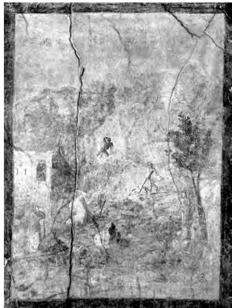
図16 「果樹園の家」 トリクリニウム (11) 西壁中央 《ディアナとアクタイオン》 PPM II, p. 53より