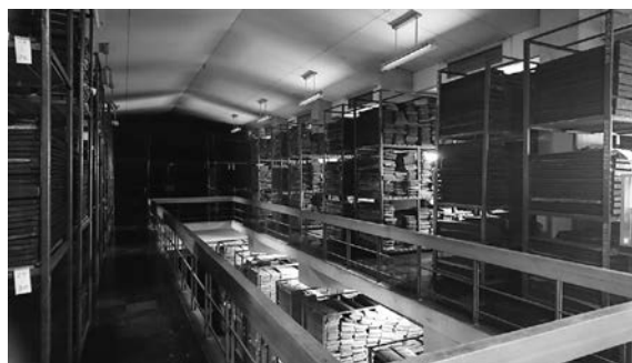
図 2. 寶藏院：6 万枚の版木が収められている

日本で最初に印刷された一切経は木活字による「天海版大藏經」だが、少数しか流布しなかった。この黄檗版は木版印刷による出版で、版木完成後は摺版を重ねて全国の寺院に流布し、仏教研究に大きく貢献した。版木は京都府宇治市の黄檗山万福寺寶藏院に現存し、昭和三十二年（1957 年）に重要文化財に指定され、現在も經本の印刷・出版が行われている。