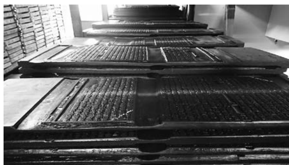
図 3. 黄檗版の版木：両面に 2 丁ずつ彫られている