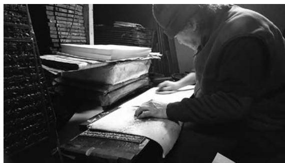
図 4. 印刷の様子：現在も印刷が行われている