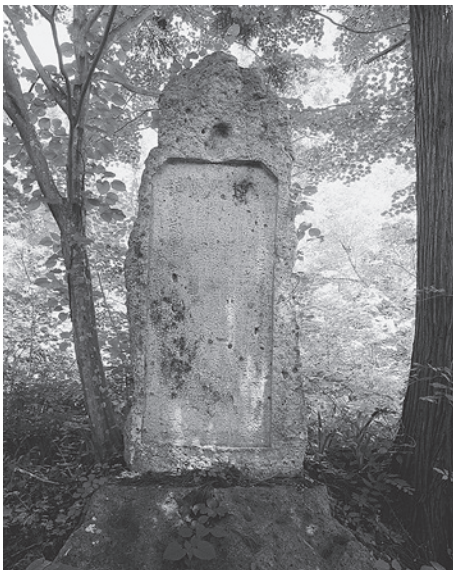
安久津八幡神社の武田軍太頭彰碑