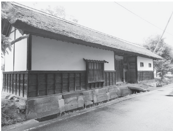
写真5 川西町 牛谷家の長屋門

牛谷家は戦国時代以来の地侍の系譜を引き、江戸時代も在郷武士として処遇されていた。同家がいつから在村道場を開いていたのかは不明だが、江戸時代中