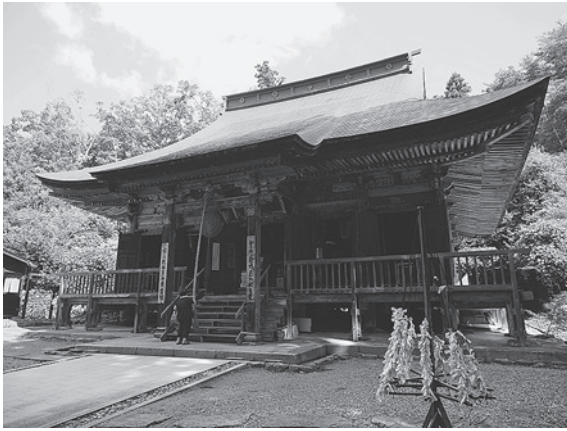
若松観音堂（天童市）