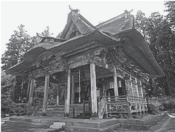
亀岡文殊堂（高島町）