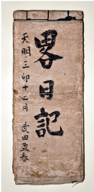
武田孫平治「略日記」表紙