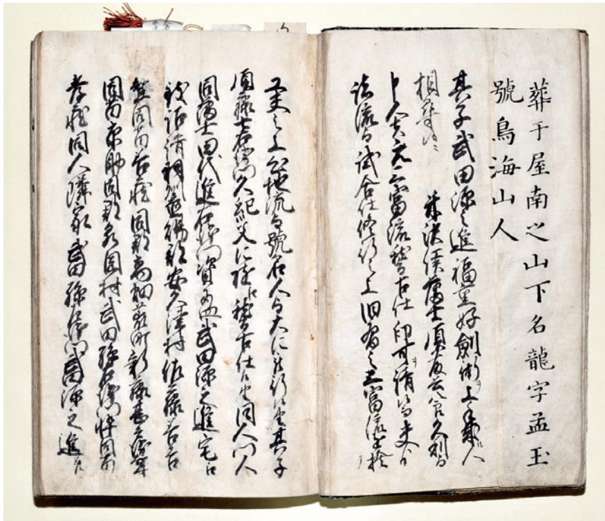
武田軍太「武元流劍術實録」本文