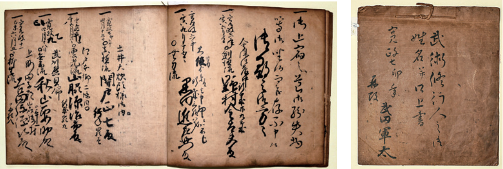
武田道場を訪れた武術修行人の名簿(史料篇 2)