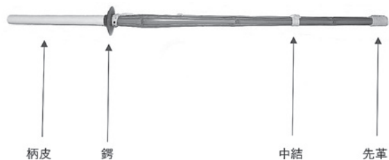
図1 竹刀の各部名称