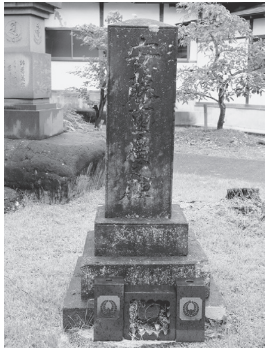
写真3 天保14年の「安藤重廣之碑」(巨海院)

こうしたことからみて、この額を奉納した門人たちは、 寒河江町に住む庶民だとみなしてよい。寒河江にも庶民剣 士が実在したことの証明になる。