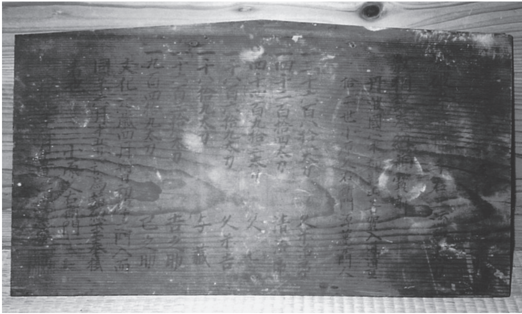
写真4 文化元年の奉納額 (三宝荒神社)