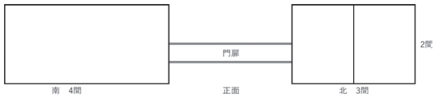
図3 牛谷家の長屋門道場

ただ一方で、寒河江倉之丞が江戸で訪ねた高名な二九軒の道場について、「道場は荒増五尺間一間にて二間四方也」（二〇七頁）とある。道場の広さが通常の二間四方だとす