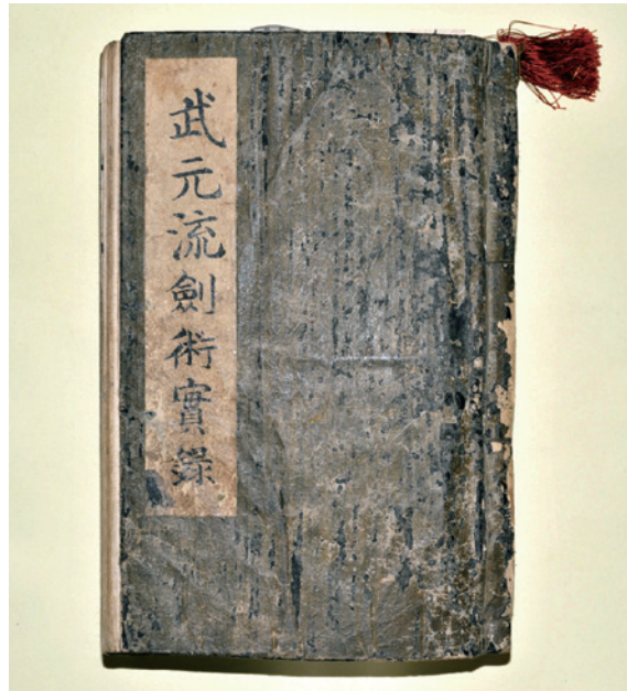
武田軍太「武元流劍術實録」表紙