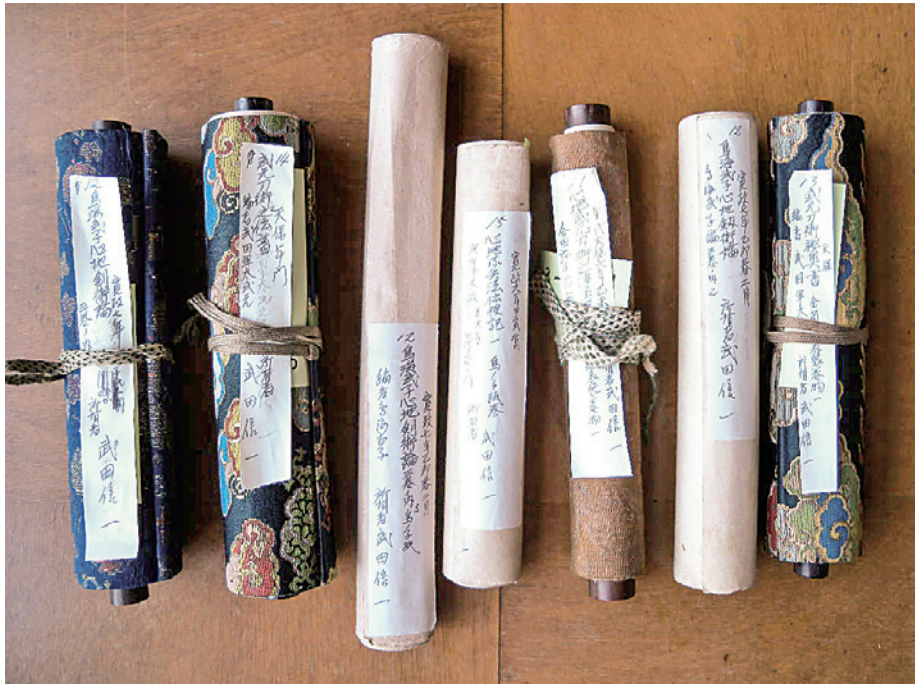
武田家の剣術伝書類