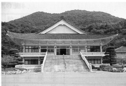
写真2 天理教韓国伝道庁 (2012年8月19日撮影)

の唯一の月刊機関誌である。文書による布教、原典に基づく確な教義理解への基準を提示するために創刊され、現在も発行されている。「教会探訪」は1974年2月から1993年7月まで、69回にわたって不定期に連載されている 39 。合計65ヶ所の教会と布教所を訪問し 40 、教会長、布教所長を対象にインタビューした内容にもとづいて作成されている。内容としては、話者が入信をとおして、どのように人生を再解釈したかに焦点が当てられている 41 。本章では、「教会探訪」の記述を手掛かりに、韓国内天理教信者の入信動機やそのパターンを分析したい。