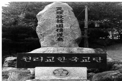
写真1 天理教韓国伝道庁と天理教韓国教団の石碑 (2012年8月19日撮影)