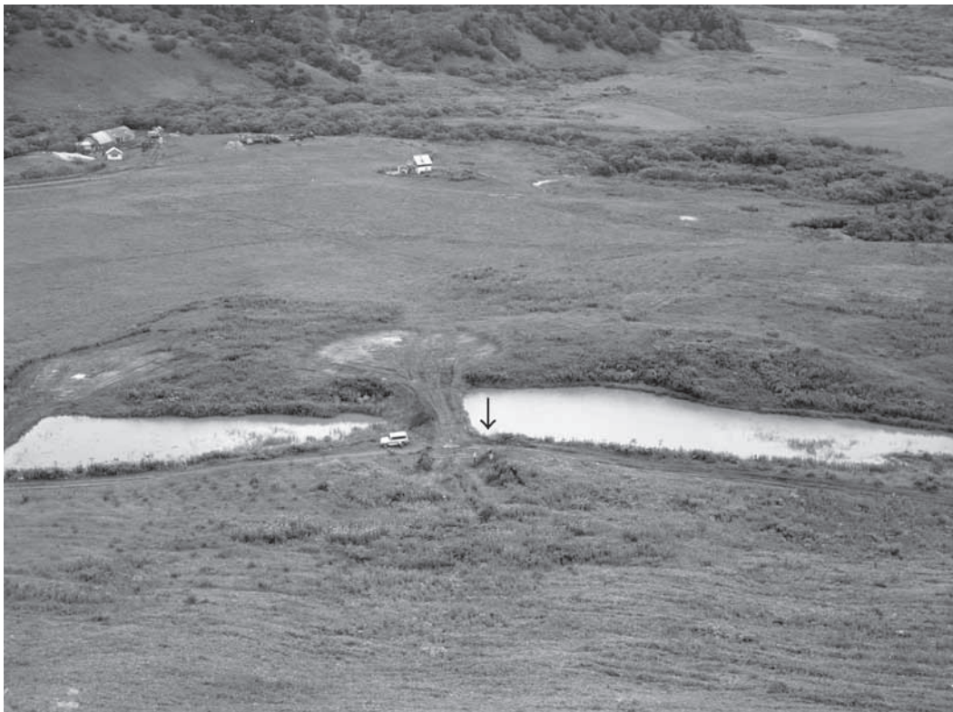
Figure. 1 Distant View of Soni-kyodo-bokujo site ( 2001)

Василевский А.А., Грищенко В.А., Кузьмин Я.В., Орлова Л.А. 2009 Хронология и периодизация эпохи неолита на Сахалине и Курильских островах (по данным радиоуглеродного датирования). Культурная хронология и другие проблемы в исследованиях древностей востока