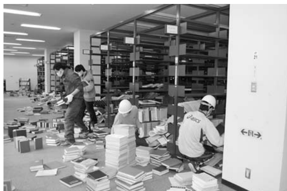
写真8 ボランティアによる復旧作業

作業時間は各自の都合により9~12時/13~16時のいずれかまたは両方とし、職員とともに製本雑誌を整理することとした(写真8)。この頃になると、年度末~初めの事務処理に追われてデスクワークに専念する職員も増えていたため、復旧作業に従事できない職員たちからヘルメットを借り、軍手やマスクも用意して身に付けてもらった。余震があっても比較的避難しやすい2階から着手し、作業時間中は通常施錠している非常口の鍵を開けておいた。職員が拡声器により作業時間の管理や非常時の指示を行うこととし、ラジオを常時つけておくなど、安全面でできる限りの注意を払った。