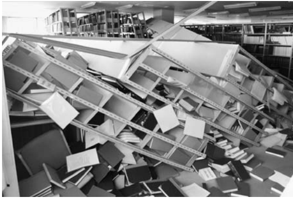
写真6 北青葉山分館の倒壊書架

全面入替して当該フロアが利用可能となるまでに、半年から一年を要することとなった。さらに北青葉山分館では、温水配管等から漏水が発生し、約 550 冊の蔵書が水損した。