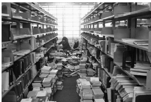
写真7 学生閲覧室の復旧作業

宅から持参した電気炊飯器でご飯を炊き、昼休みに職員へおにぎりを配ることができるようになった。