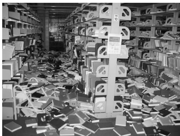
写真3 学生閲覧室の落下資料

宮城県沖地震（1978年）の際に撮影された本館内の写真 1) と比較すると、今回の方が落下資料数は