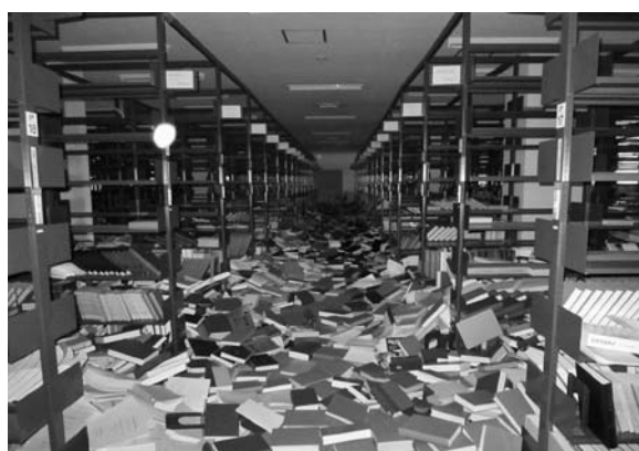
写真4 製本雑誌書架の落下資料