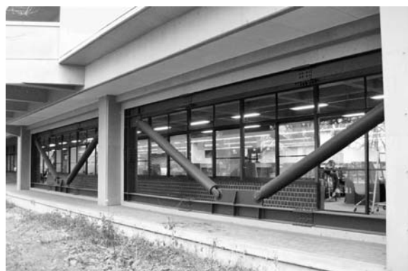
写真2 ベランダの鋼管ブレース