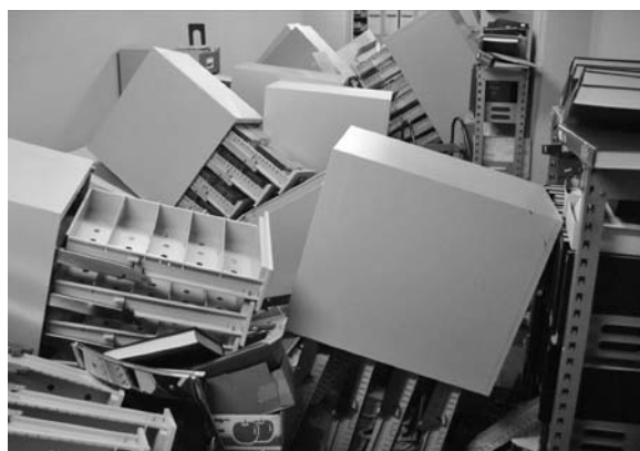
写真5 マイクロフィッシュキャビネット

圧倒的に多く、地震の規模の大きさと揺れの長さを物語っているが、一方で転倒した書架の数は少ないことがわかる。これは、宮城県沖地震以降、書架を極力固定するなどの対策を講じてきたためと思われる。固定していなかったキャビネット類は、設置場所にかかわらず軒並み激しく転倒している（写真5）。