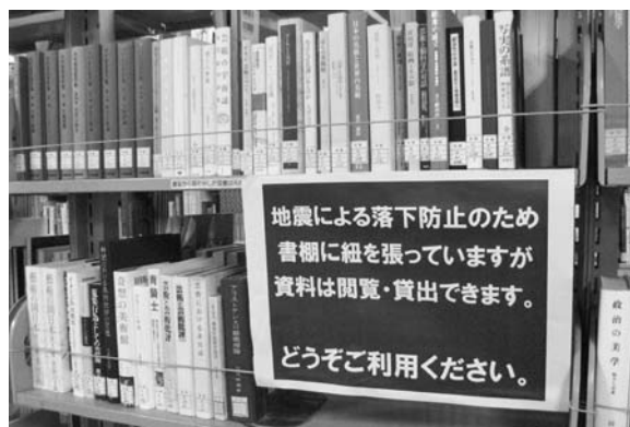
写真9 紐を張った学生閲覧室の書架